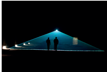
Lasershow in der Hightechkammer.JPG

Lichtinstallationen erleuchten die endlos wirkenden Gänge unter Tage.