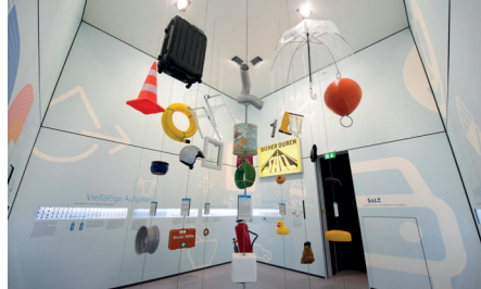
Kubus 3 – Salzverwendung im Alltag.JPG

Interaktives Labor für Jung und Alt im begehbaren Kubus: „Salz zum Anfassen“.