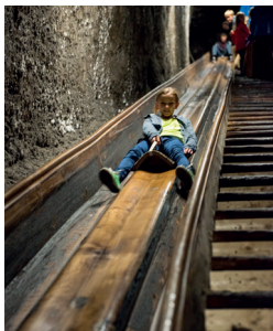
Rutsche unter Tage.JPG

Der Spaziergang unter Tage führt durch die Hightechkammer auf eine Lasershow zu.