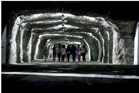
Durchgang zur Geologiekammer.JPG

Lichtinstallationen erleuchten die endlos wirkenden Gänge unter Tage.