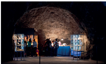
Mineralien, Edelsteine und Fossilien.JPG

Salz belebt unseren Alltag, bei Lebensmitteln, in der Industrie, Medizin oder im Winter.