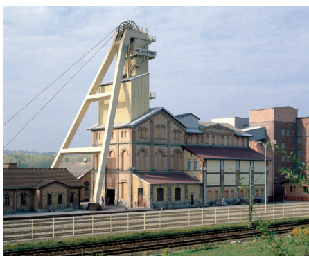
Foerderturm Koenig Wilhelm II.JPG

Die Geologiekammer stellt faszinierende Hinweise über das „weiße Gold“ in sogenannten Informationskuben dar und enthält die wohl längste Vitrine der Welt.