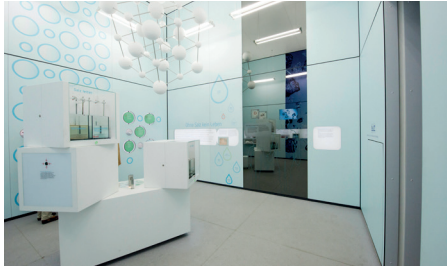
Kubus 2 – Chem. Zusammensetzung.JPG

Interaktives Labor für Jung und Alt im begehbaren Kubus: „Salz zum Anfassen“.