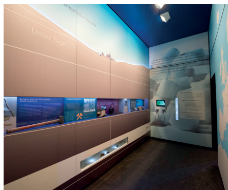
Kubus 1 – Salzentstehung.JPG

Nach nur rund 30 Sekunden Fahrt mit einem Förderkorb in 180 Meter Tiefe erwartet Sie die faszinierende Welt des „weißen Goldes“.